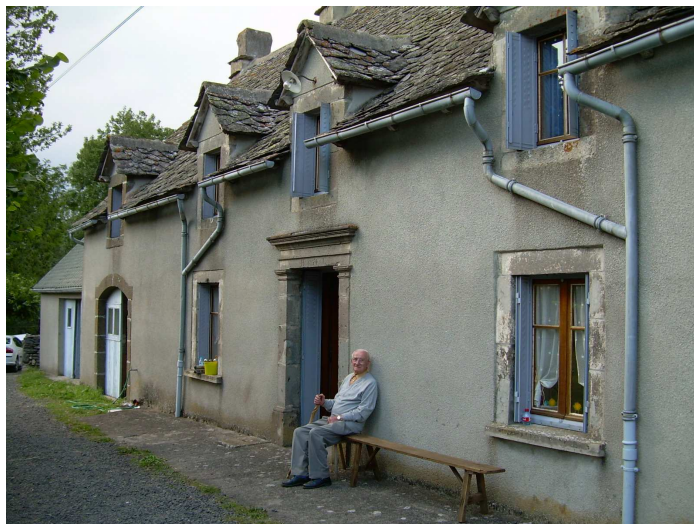
Rochevaire : * l'entrée de la grange où se déroula le repas des mariages.