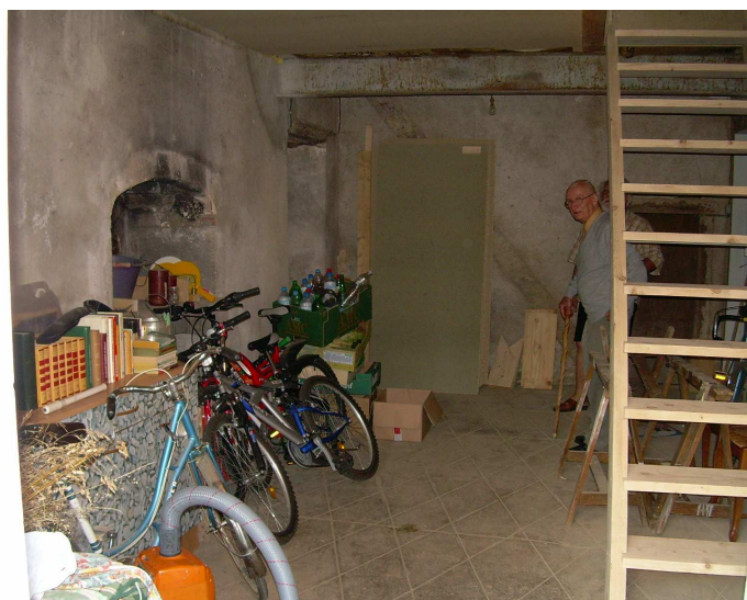
* la pièce du repas pour 25 personnes.