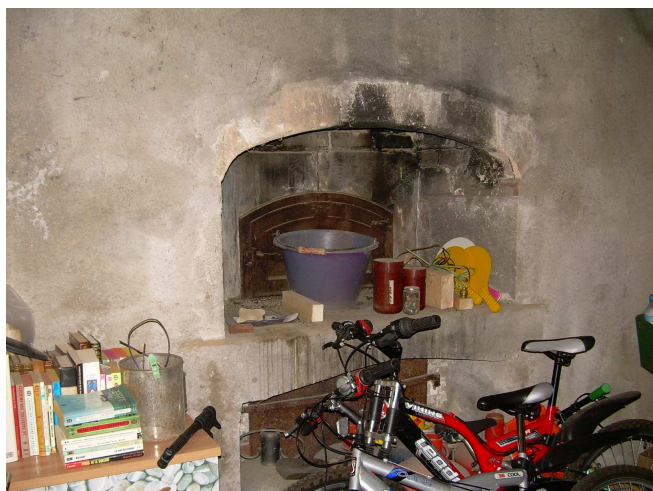
Rochevaire : * le four